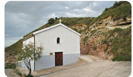
Ermita de Aradón

Este lugar de Aradón se cita por primera vez en textos de 1044, existiendo con posterioridad referencias de que fue una posesión templaria. No se sabe a ciencia cierta cuándo desapareció el enclave, pero en el año 1800 consta como despoblado en los escritos de un pleito entre el Cabildo de Calahorra y el Señor de Murillo.